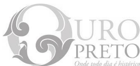
Figura 4 - Identidade visual da cidade de Ouro Preto, Brasil.

território. O setor do design e das artes visuais exercem um papel importante nesta ação. Ouro Preto possui uma nova identidade visual, conforme Figura 4. Entretanto, a identidade visual criada precisa ser alvo de ações de comunicação e relações públicas, inclusive ser incorporada nos bens culturais e pelos setores criativos, a fim de ser validada e legitimada pela comunidade, mercado e Estado.