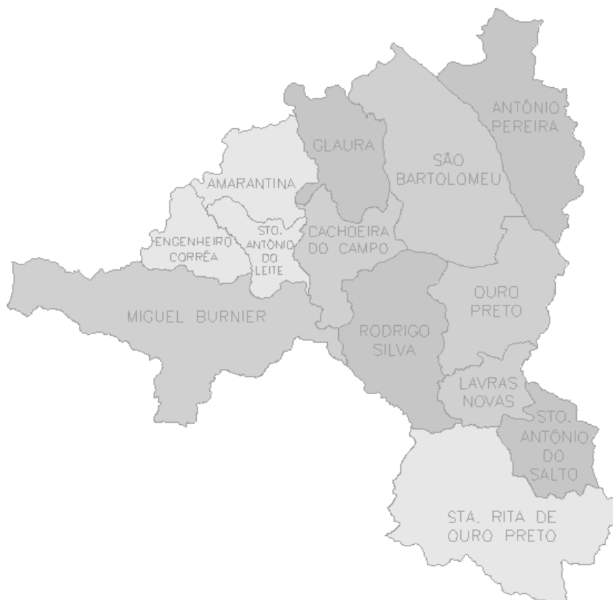
Figura 2 - Localização dos distritos do município de Ouro Preto, Brasil.