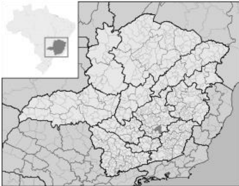
Figura 1 - Localização de Ouro Preto no mapa de Minas Gerais, Brasil.