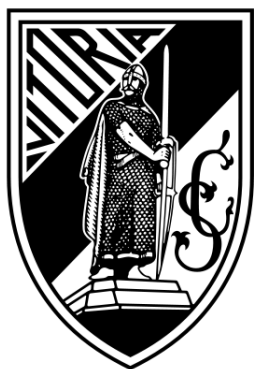
Figura 1 - Emblema do Vitória SC

O projeto foi realizado no Vitória Sport Clube, que é uma entidade desportiva portuguesa fundada a 22 de setembro de 1922 e com sede na cidade de Guimarães. O seu emblema foi inspirado em D. Afonso Henriques, que é o fundador de Portugal, e as cores usadas, preto e branco, simbolizam a igualdade e a admissão de todos independentemente da raça, tal como se pode ler no site oficial do clube. A sua principal modalidade é o futebol, mas esta entidade desportiva é também reconhecida (anexo 1) em modalidades amadoras como o basquetebol, o voleibol, a natação, o polo aquático, o futebol de praia, o jiu-jitsu , o taekwondo e o kickboxing .