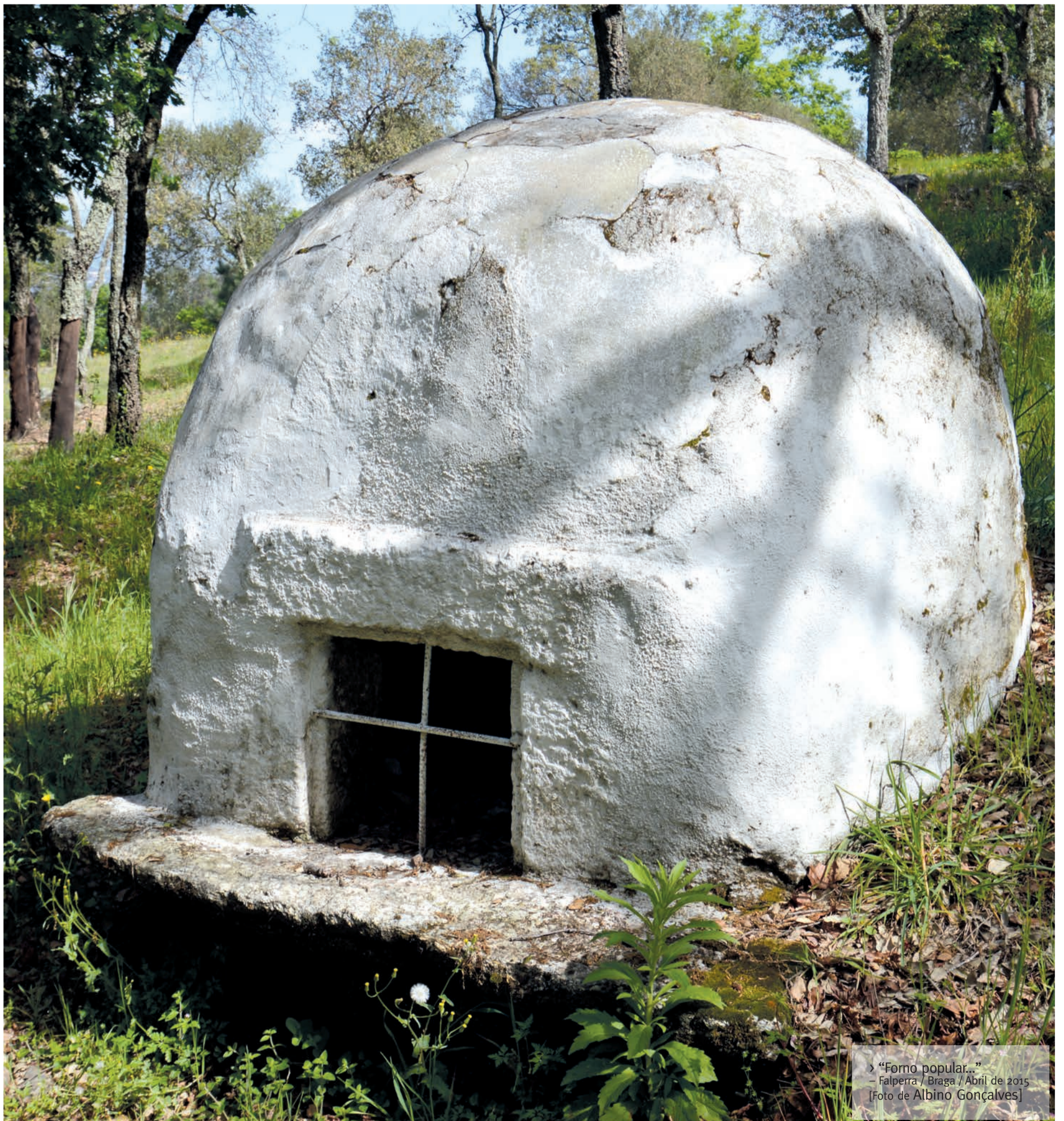
› “Forno popular...” – Falperra / Braga / Abril de 2015

Este suplemento faz parte da edição n.º 30700 de 10 de junho de 2015, do jornal Diário do Minho , não podendo ser vendido separadamente