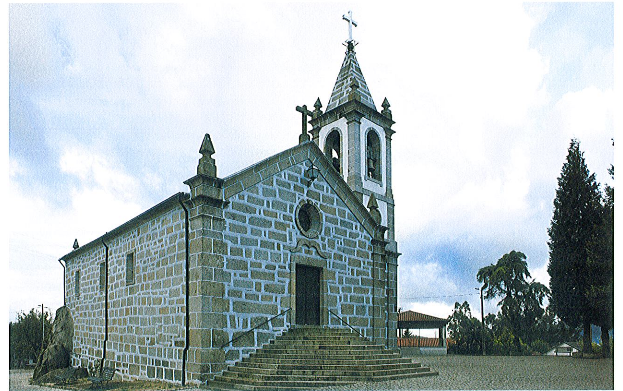
Capela de Nossa Senhora de Pedra Maria.

sava nos altares das igrejas e das capelas, mas também se intensificavam nas confrarias.