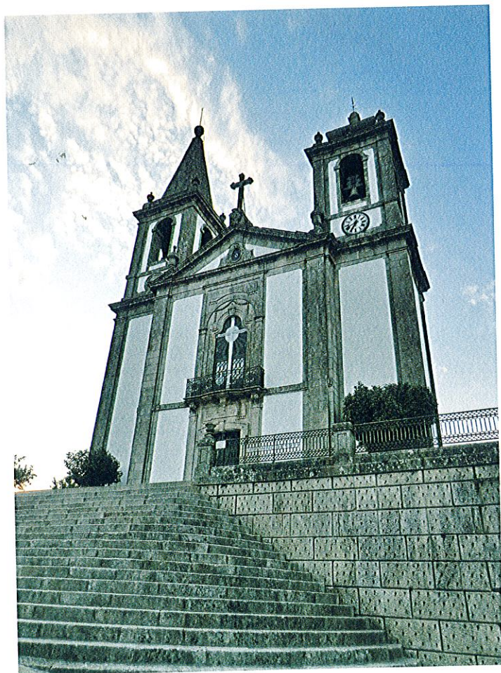
Santuário do Bom Jesus de Barrosas.

ou a proximidade da morte. Estas eram imagens com fama de milagrosas e especialmente protetoras de certas situações.