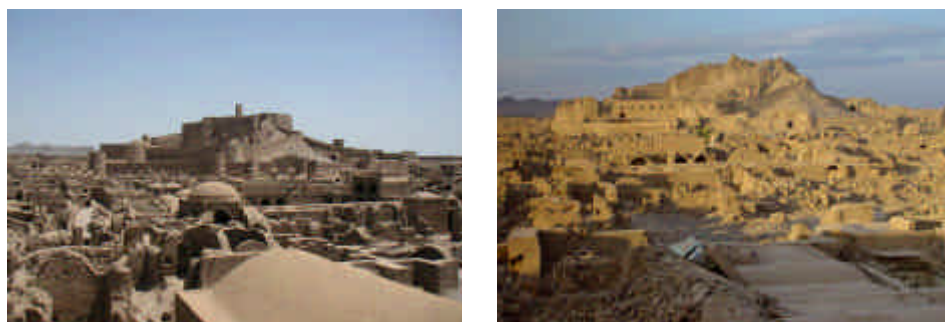
Figura 1 – Cidade de Bam (Irão), antes e depois do sismo de Dezembro de 2003.

Recentemente, a cidade histórica de Bam, localizada no Irão, foi atingida por um sismo de magnitude 6.6, em 26 de Dezembro de 2003. Mais de 70% dos edifícios da cidade colapsaram, ver Figura 1. A cidadela de Bam, com cerca de dois mil anos de idade, património da humanidade e considerada a maior fortaleza feita de argila em todo o mundo, ficou destruída.