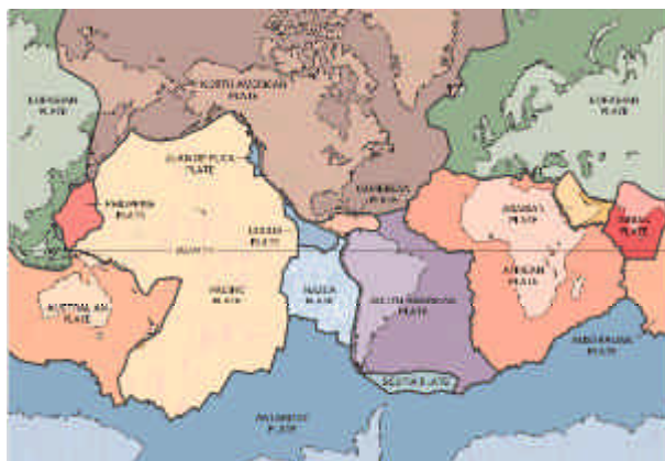
Figura 2 - Principais placas tectónicas terrestres.

Além da falha Açores-Gibraltar, existem ainda outros acidentes tectónicos, dos quais se destacam como mais importantes, a falha do Vale Inferior do Tejo (sismos de 1344, 1531 e 1909), a falha de Loulé (sismos de 1587, 1722 e 1856), a falha da Vilariga (sismos de 1751 e 1858) e a falha da Nazaré (sismos de 1528 e 1890). A magnitude dos principais sismos que afectaram Portugal continental, associados às falhas referidas, está indicada na Tabela 2.