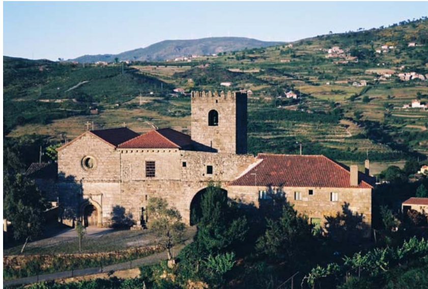
Vista do fabuloso conjunto formado pela igreja românica de Cárquere, mosteiro e torre fortificada.