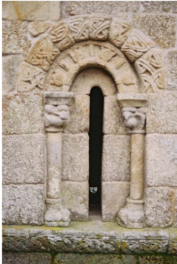
Janela da capela dos Condes de Rezende em Cárquere, de nítida influência oriental