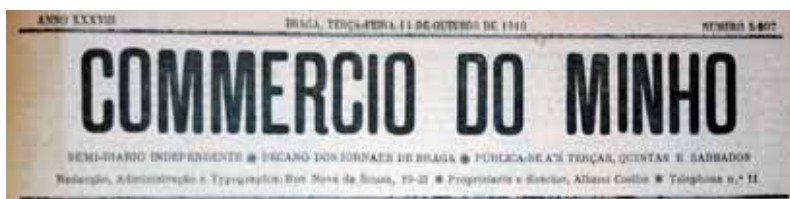
Comércio do Minho.

Concluimos que este jornal defende e pretende impor os interesses monárquicos, apesar de se declarar independente. A neutralidade política e a identificação com o interesse geral constituem elementos centrais na estratégia de O Comércio do Minho .