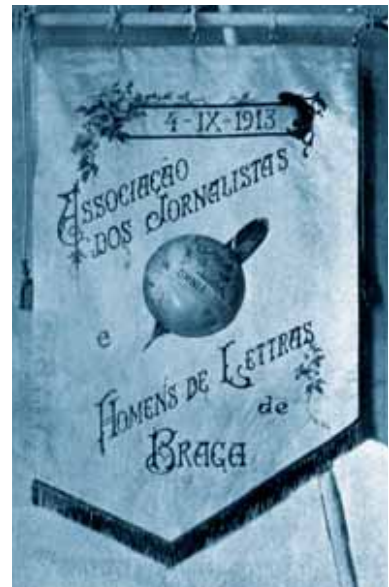
Pendão da Associação dos Jornalistas e Homens de Letras de Braga.

A imprensa da cidade de Braga, à semelhança do jornalismo português da época, vivia e ecoava as tensões sociais do momento, marcado pelo confronto e pela radicalização das forças políticas e religiosas. Mas que forças eram essas? Como reagiram os jornais perante uma mudança estrutural tão prometida, por um lado, e face à República debutante sob o signo da ameaça monárquica, por outro? Terá Braga reagido de pronto ao toque de Lisboa? Terá a imprensa de Braga reagido de uma forma uníssona? Partindo dos resultados da análise de conteúdo (Bardin, 1988) que fizemos, respondemos em seguida a estas questões, não sem antes dar conta de algumas das características do tipo de jornais produzidos à época na cidade de Braga.