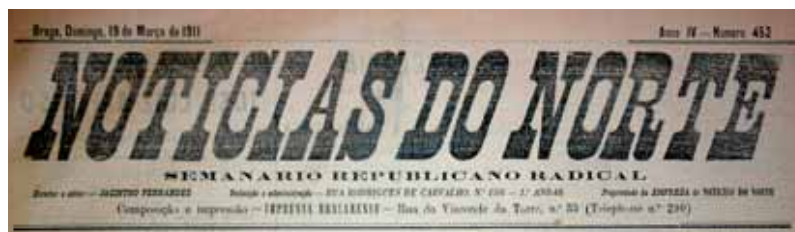
Notícias do Norte.

Face aos restantes títulos, ora mais defensores da Monarquia, ora mais defensores de interesses religiosos, O Radical é único a celebrar a vitória da República sobre a Monarquia e a elogiar a acção do Governo Provisório no plano religioso. Daí a natureza polémica do regime do seu discurso, e a demarcação da consensualidade reinante. O Radical retoma o discurso dos outros jornais, mas na forma inversa. Chega a retomar o discurso de O Combate (e vice-versa) para o subverter e mesmo para lançar ameaças de repressão ao que qualifica de actividade conspirativa. Elogia a República pelo patriotismo , pela benevolência e generosidade demonstradas, apoia e elogia a acção do Governo contra as ordens religiosas e monárquicas , qualificando-a de fraterna e complacente . Chega mesmo a apelar à repressão dos monárquicos que intitula de conspiradores, ambiciosos e falsos patriotas . Condena a Monarquia por ter atentado contra os interesses do povo , contrapondo a luta do Governo republicano pela causa popular , a sua obra de regeneração social e moral e de salvação da nacionalidade .