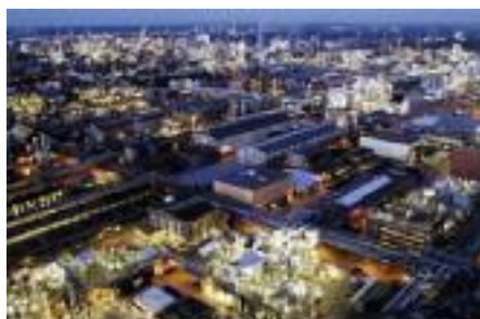
ao lado Ludwigshafen, 2007.

Todas estas definições demonstram a importância de inclusão de áreas de conhecimento como a Biologia, a Microbiologia e a Genética, para além das tradicionais, na formação de um Engenheiro Químico/Biológico/Bioquímico. Os Engenheiros Químicos/Biológicos/Bioquímicos devem ter conhecimento dos princípios e processos celulares e biomoleculares. A Química e a Biologia estão cada vez mais em pé de igualdade como ciências de base para a sua formação. De salientar que a utilização quase indiferenciada dos termos Engenharia Química, Engenharia Biológica