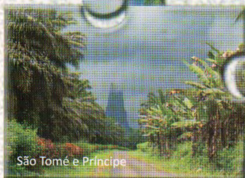
São Tomé e Príncipe