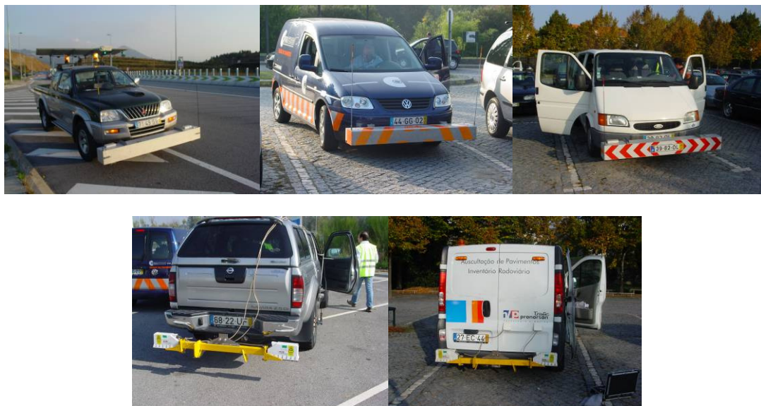
Figura 2 – Perfilómetros usados nos ensaios

Os perfilómetros utilizados nos ensaios pertencem a universidades, laboratórios de investigação e empresas de consultoria (Figura 2). Para a medição do perfil longitudinal, estes perfilómetros integram um acelerómetro, usado na obtenção do movimento vertical do corpo do veículo, e um sensor tipo laser, usado na medição do deslocamento entre o corpo do veículo e a superfície do pavimento. O perfil da estrada é obtido somando o movimento do corpo do veículo com o deslocamento veículo/pavimento.