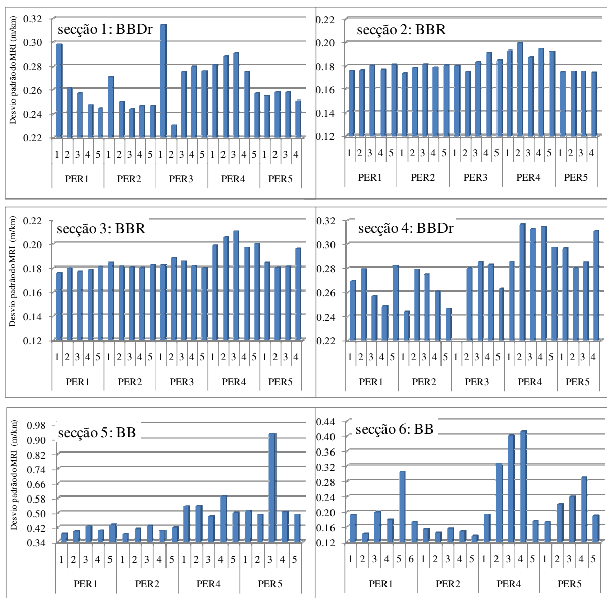
Figura 4 – Desvio padrão do MRI por secção e por perfilómetro

Os desvios padrão estão compreendidos entre 20 e 30% da média, para qualquer equipamento e em qualquer passagem. No caso particular do betão betuminoso denso a razão entre o desvio padrão e a média do MRI é ligeiramente superior à das outras camadas.