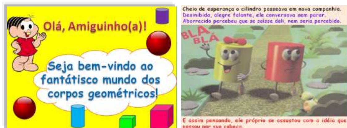
Figura 2: Narrativa sobre os corpos geométricos

A segunda Narrativa Digital desenvolvida tinha como objectivo contar a estória de uma personagem que vivia em um mundo de corpos geométricos distintos e parte em busca de um local onde os possa encontrar outras formas cilíndricas. Esta narrativa foi concebida com o intuito de trabalhar as formas geométricas no ensino da matemática (ver figura 2).