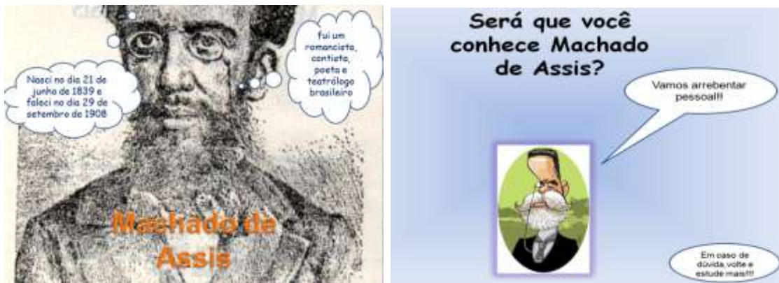
Figura 4: Narrativa sobre Machado de Assis

A quarta narrativa digital tinha como objectivo contar a vida e obra de um importante escritor brasileiro, chamado Machado de Assis. A narrativa digital foi planeada para ser utilizada na disciplina de literatura brasileira (ver figura 4).