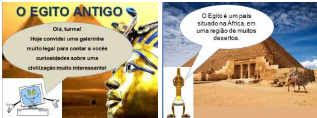
Figura 3: Narrativa sobre o Egito antigo

A quarta narrativa digital tinha como objectivo contar a vida e obra de um importante escritor brasileiro, chamado Machado de Assis. A narrativa digital foi planeada para ser utilizada na disciplina de literatura brasileira (ver figura 4).