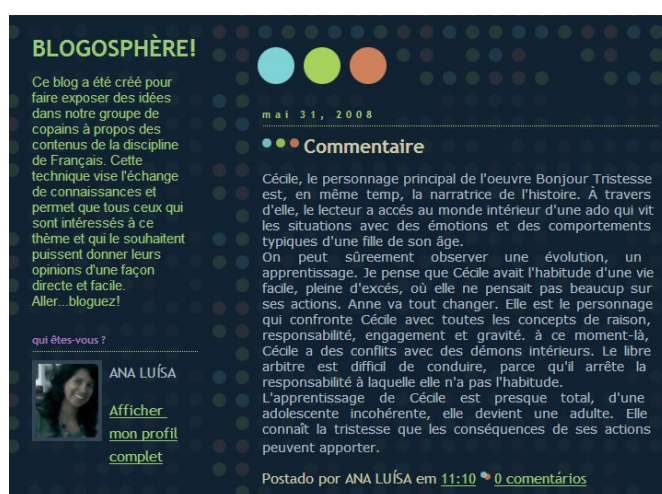
Figura 1. Exemplo de um blogue criado por uma aluna

O projecto decorreu nos anos lectivos 2006 /07 e 2007/08, período durante o qual os alunos editaram conteúdos (figura 1) 1 , sob diversos formatos (textos, imagens e vídeos) e relacionados com os temas do programa da disciplina em questão, comentaram também os textos dos respectivos colegas de turma, dando também resposta a alguns desafios lançados pelo docente, quer no seu blogue, quer nas aulas (figura 2) 2 .