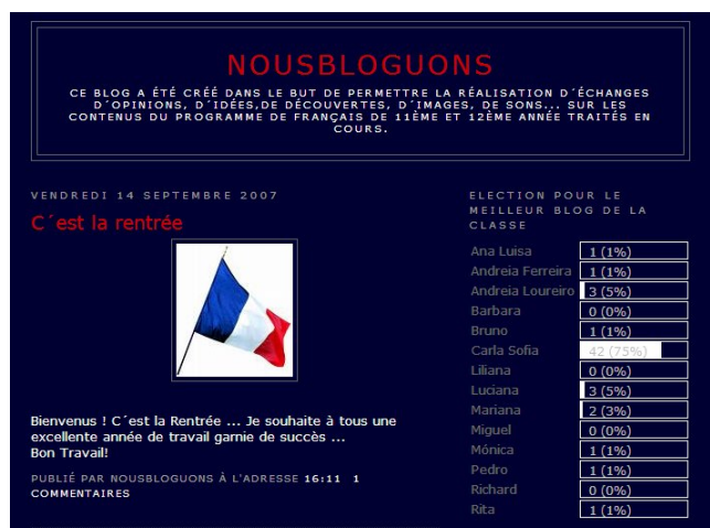
Figura 2. Apresentação do blogue da professora

A técnica de recolha de dados utilizada foi o inquérito por questionário. O questionário destinado aos alunos e administrado no final de Março 2008, integrava as seguintes dimensões: