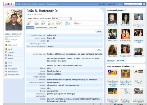
Fig. 1: Perfil de um utilizador no Orkut

página de perfil de um dos autores pode ser visto na figura 1.