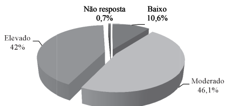
Figura 3 – Nível de stress dos pais de CNE

O nível de stress parental variou de baixo (10,6%), moderado (46,7%) a elevado (42%) (Figura 3).