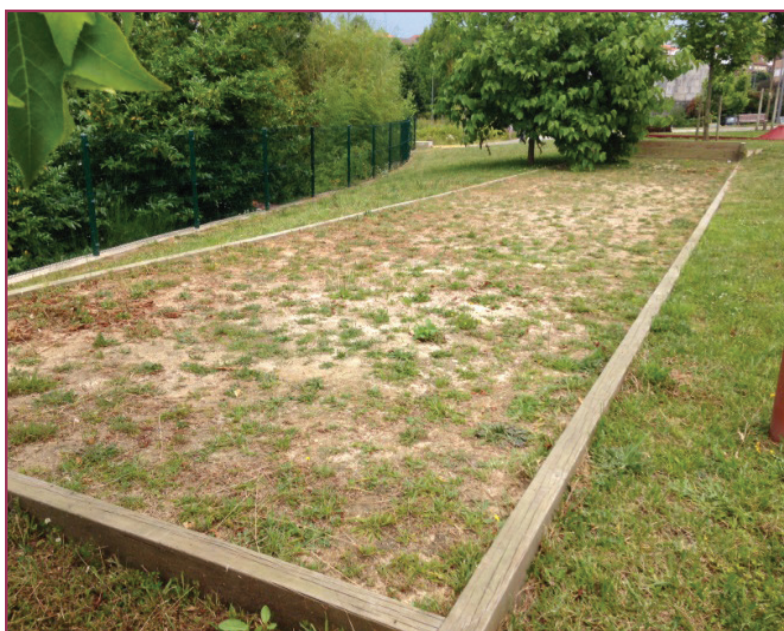
Figura 2 - Campo para el Jogo do Chavelho situado