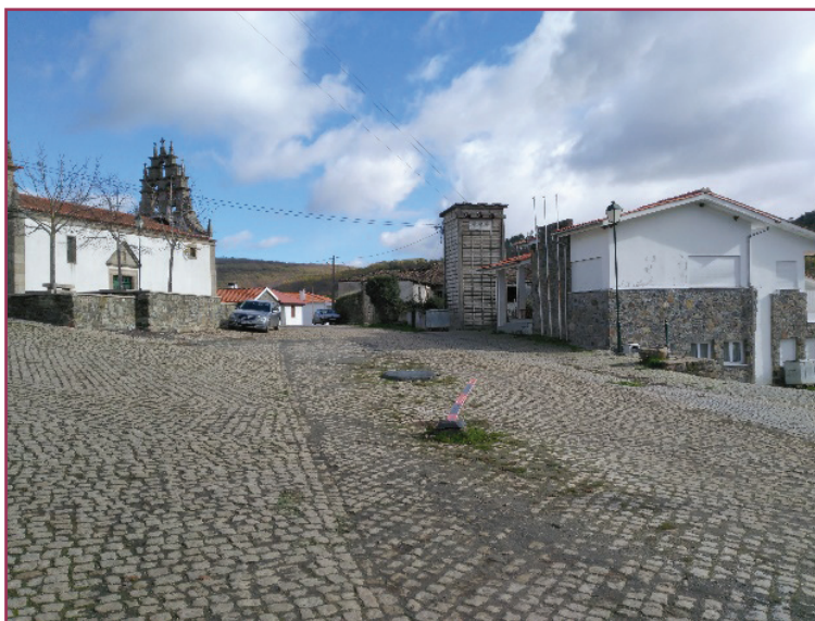
Figura 8 - Campo de juego de bolos en el centro del pueblo (Carrazedo-Bragança), al lado de la iglesia.