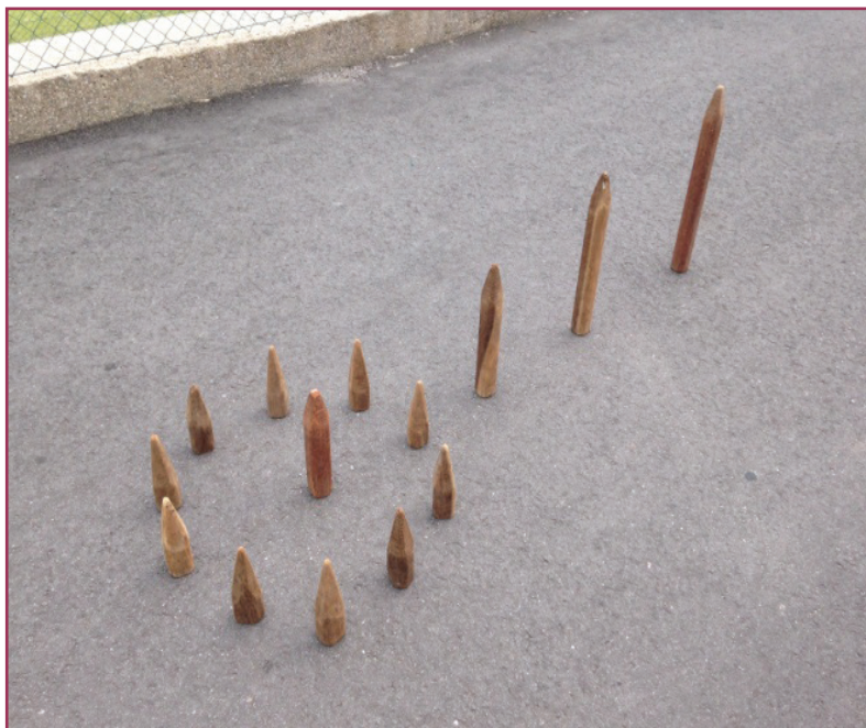
Figura 3 - Distancia y disposición de los 14 Chavelhos en el Parque das Portas do Corno do Bico.