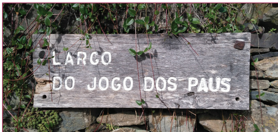
Figura 10 - Referencia al campo de bolos o Jogo dos Paus situado en Carrazedo.