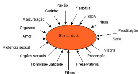
Figura 3: Ideias iniciais dos/as alunos/as sobre sexualidade

Verificou-se que para estes/as alunos/as, os principais conceitos-chave sobre a sexualidade humana são no âmbito dos relacionamentos (paixão, amor, carinho, filhos/as), cultura, sociedade e direitos humanos (pedofilia, prostituição, violência sexual), desenvolvimento humano (órgãos sexuais), comportamento sexual (sexo, orgasmo, masturbação, viagra, homossexualidade) e saúde sexual e reprodutiva (Sida/AIDS, pílula, prevenção, preservativos), estando principalmente focados em tópicos relacionados com a sexualidade e direitos humanos, comportamento sexual e saúde sexual e reprodutiva. Estes conceitos-chave, incluindo outros tópicos mais alargados e o trabalho com a clarificação de valores, as atitudes e competências, são os tópicos defendidos pela UNESCO (2009 a, 2009b), pela WHO-Europe & FCHE, BZgA (2010) e pelo Governo Português (PORTUGAL - MINISTÉRIOS DA EDUCAÇÃO E DA SAÚDE, 2010) para a educação em sexualidade.