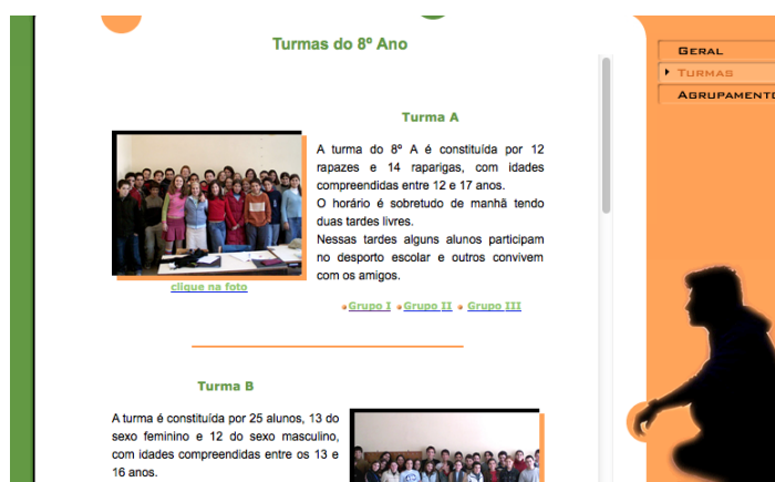
Figura 2: Apresentação dos/as alunos/as.

As professoras decidiram, após consultar os/as alunos/as, começar o projeto pela apresentação dos alunos/as, da escola e da comunidade para facilitar a sua interação online com as outras escolas envolvidas no projeto (Figura 2).