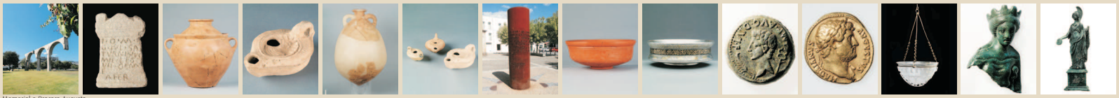
Memorial a Bracara Augusta