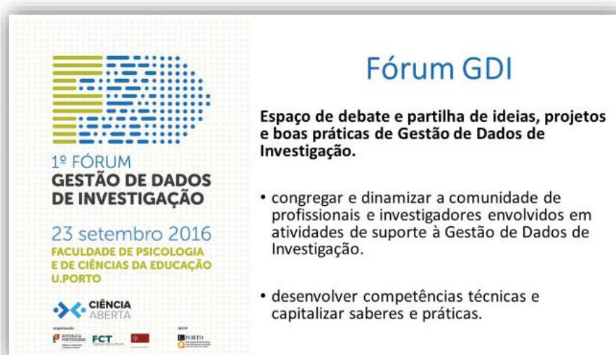
1 - Slide de abertura do evento com apresentação dos objetivos do Fórum

O primeiro Fórum quis desde logo definir um tipo de evento com forte componente interativa e de dimensão prática, onde se procurasse escutar as necessidades dos diferentes agentes que apoiam a gestão de dados de investigação nas instituições do espaço de ciência e inovação português, procurando ainda capacitar esses profissionais na utilização de ferramentas que apoiam diferentes processos da Gestão dos Dados de Investigação.