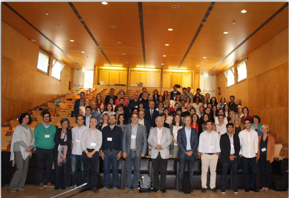
3 - Participantes no 1º Fórum GDI: foto de grupo