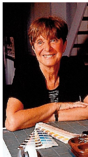
A escritora Adela Turín

coas leis sociais do microcosmos habitado polos elefantes.