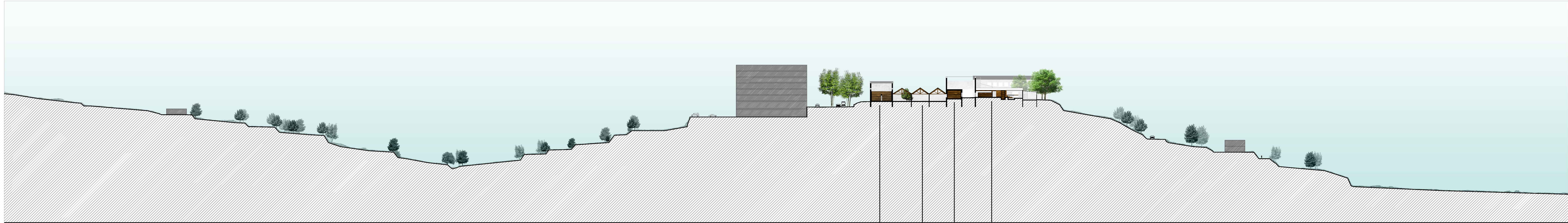
Corte E cota 100 Comercio Praça interna Libreria/Papelaria Biblioteca

As antigas fábricas de Tabopan de Amarante Uma reabilitação 100% local Corte E e F Mélanie Lydie Lemaire Ferreira Escala 1/1000 Nº 49859