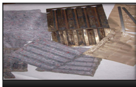
Figura 1B – Eco compósito moldado

Os materiais foram produzidos com base nesses conjuntos de não-tecidos, utilizando técnica de moldagem por compressão. Um molde especial foi desenvolvido para dar a forma adequada para o eco compósitos. Os materiais assim produzidos foram então testados em termos de desempenho mecânico e térmico, a influência dos fatores variados no não-tecidos foi analisado. O desempenho apresentado por estes materiais apresenta grande potencial de aplicação quando comparados aos existentes no mercado.